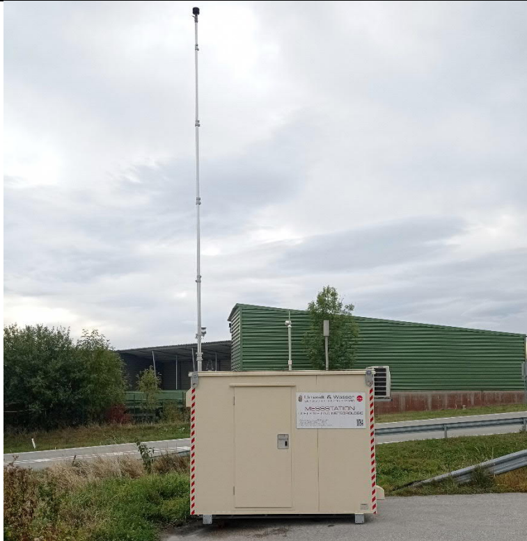
Aufnahmedatum: 23.10.2023 in Richtung Südost