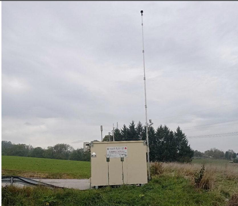
Aufnahmedatum: 23.10.2023 in Richtung Nordwest